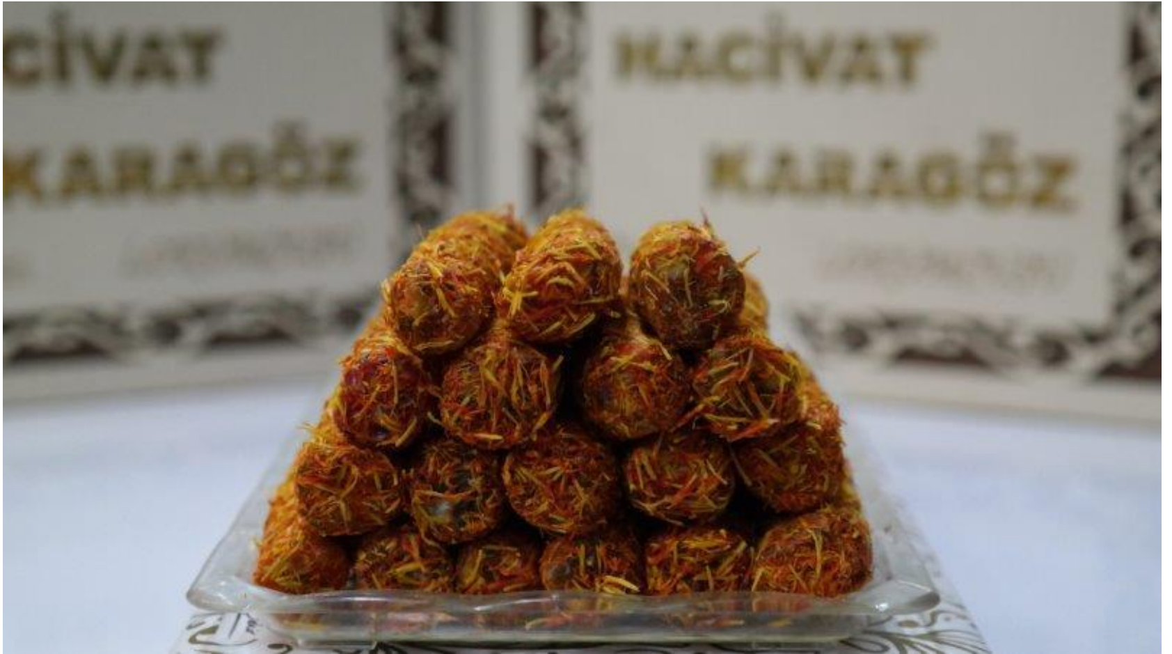
Narlı Safranlı Antepi Parmak Lokum