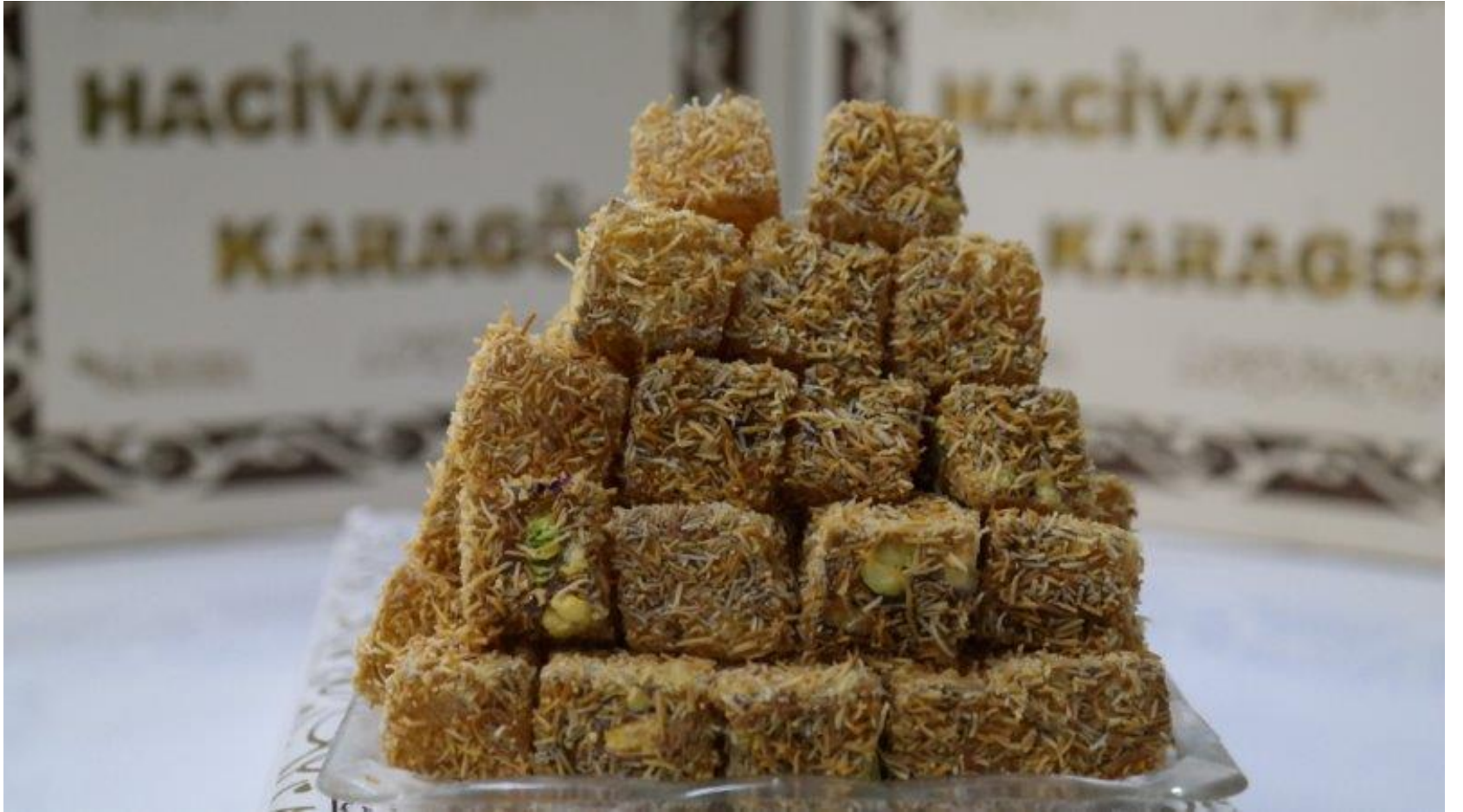
Narlı Antepli Kadayıf Kaplı Çifte Kavrulmuş Lokum