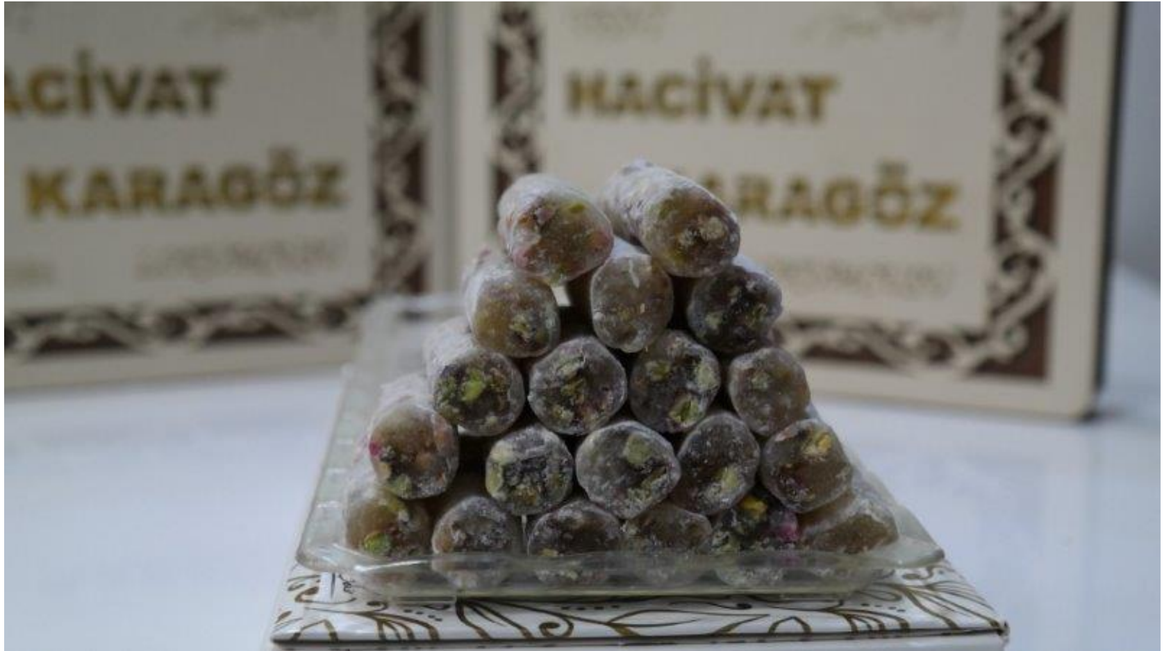
Balı Fıstıklı Parmak Lokum