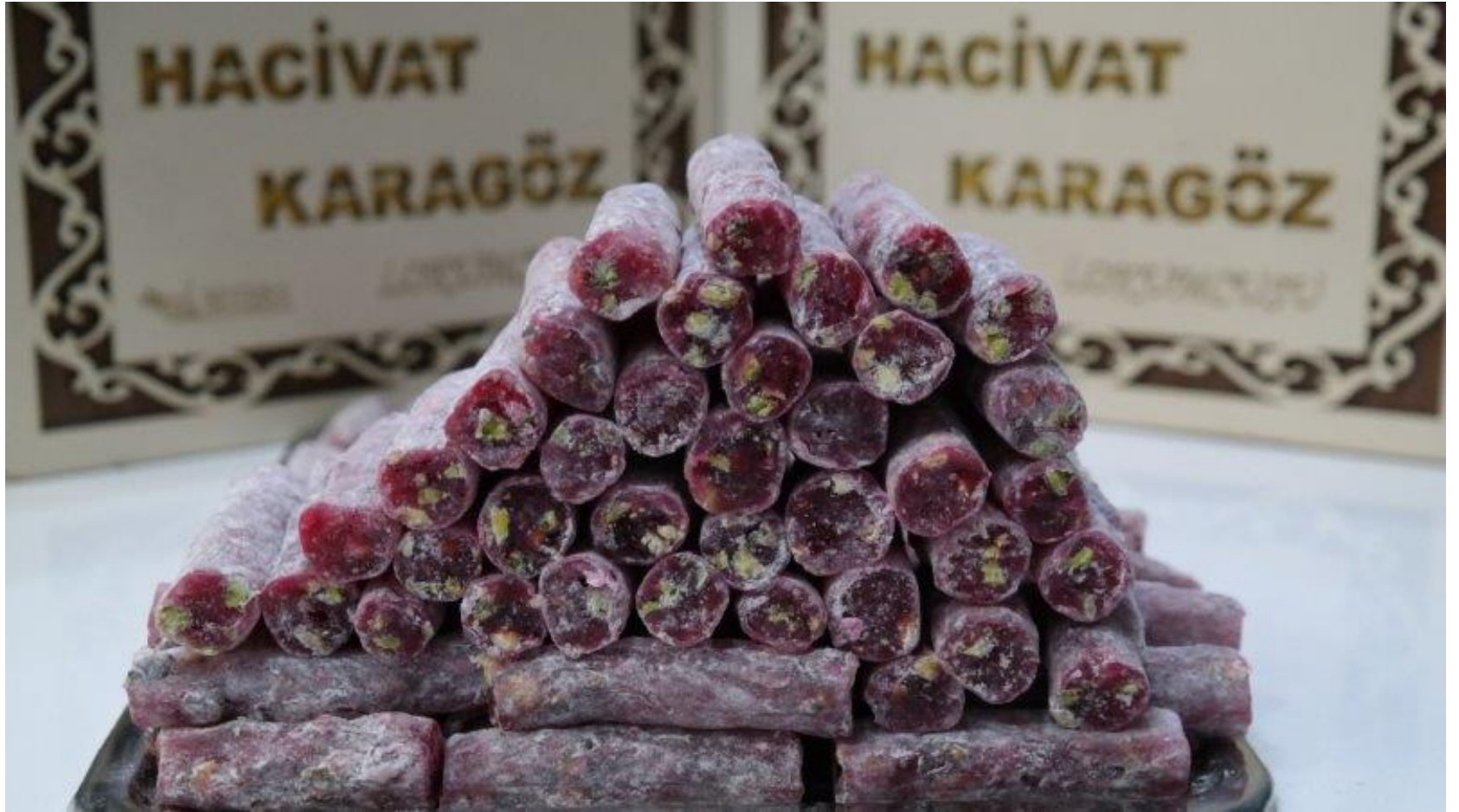
Narlı Antepi Parmak Lokum