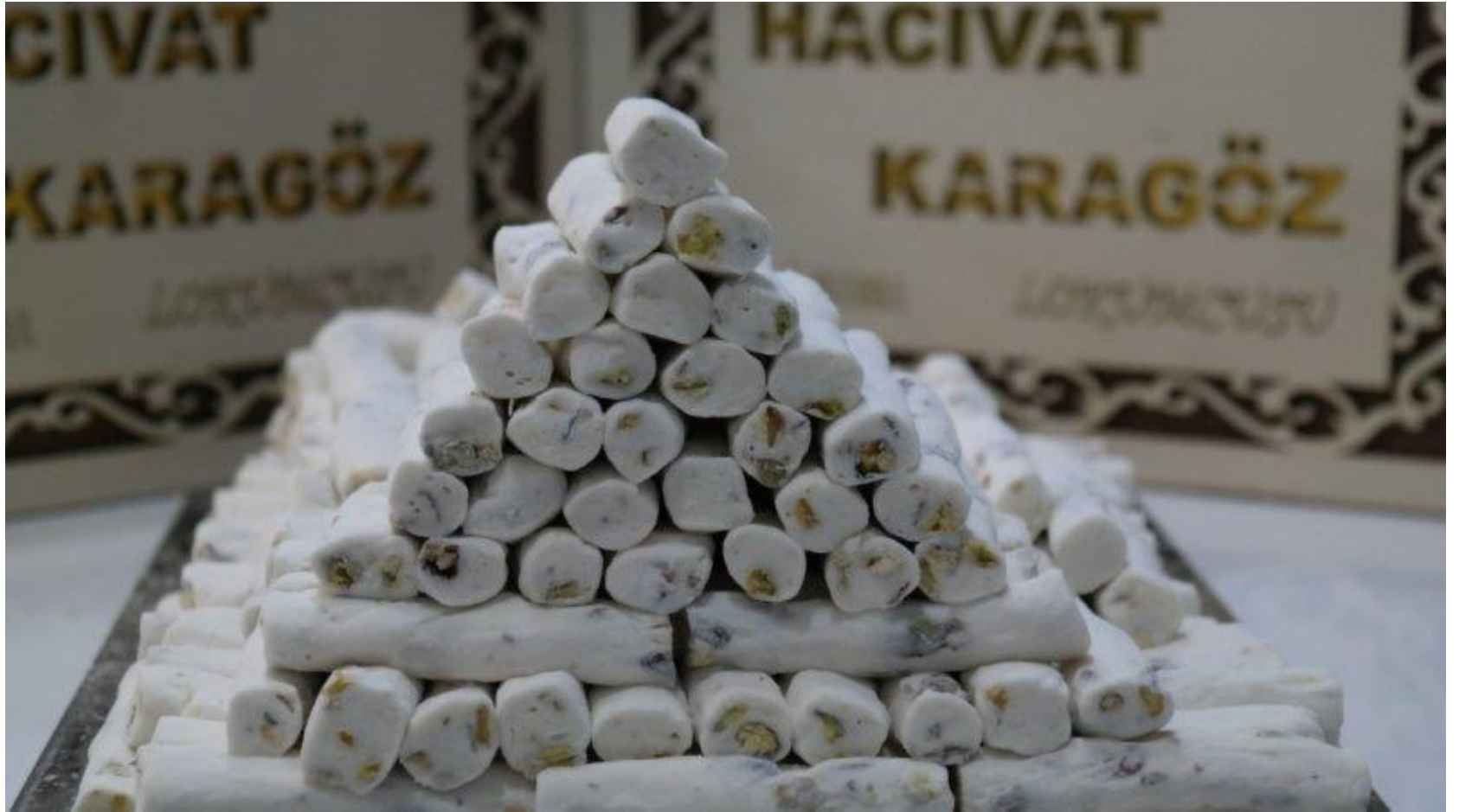
Sultan Antep Parmak Lokum