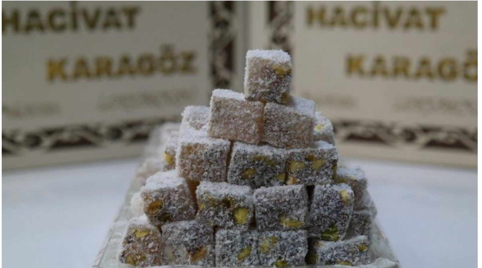
Çifte Kavrulmuş Hindistan Cevizli Lokum