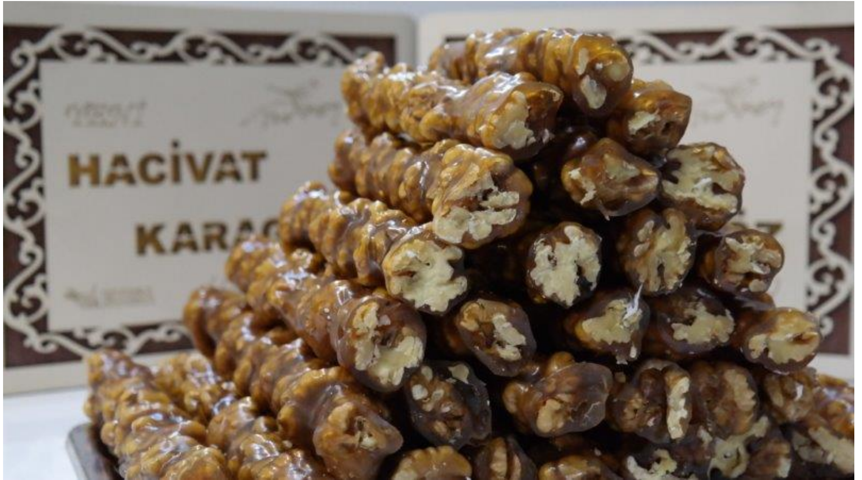
Cevizli Sucuk Lokumu