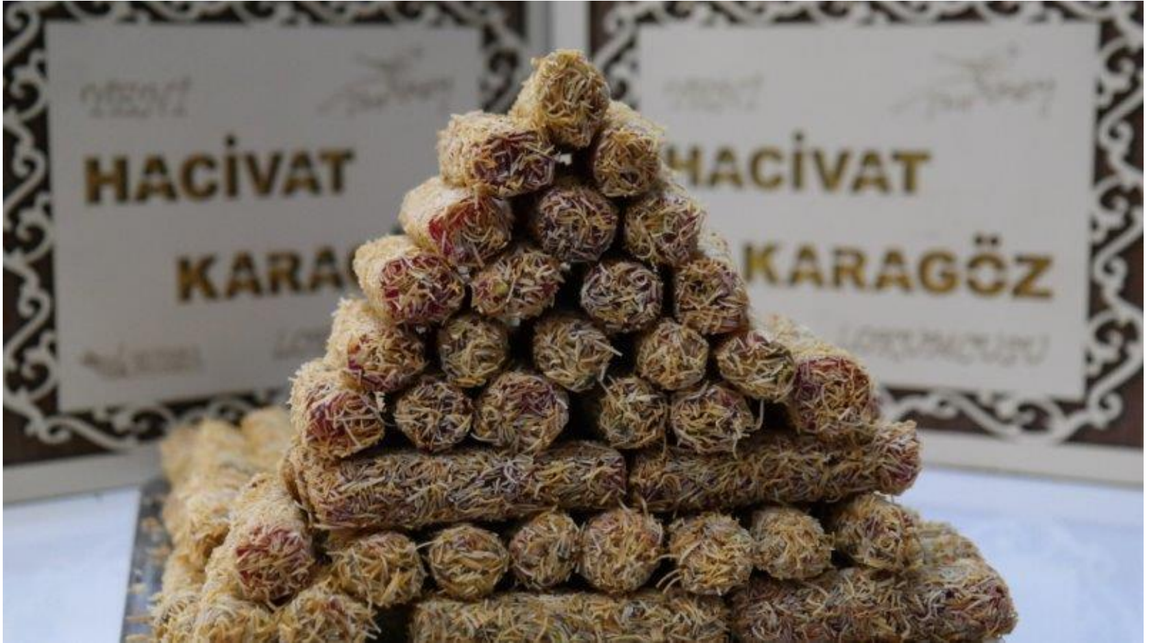
Narlı Antepi Kadayıf Parmak Lokum